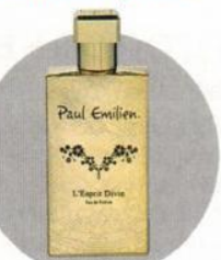
Paul Emilien L'Esprit Divin

Я считаю, что парфюм — это подарок. Либо близкому человеку, либо самому близкому, то есть себе. Поэтому очень важно его правильно оформить. Все ароматы Paul Emilien хранятся в бархатной книжке с горячим золочением, никакого картона